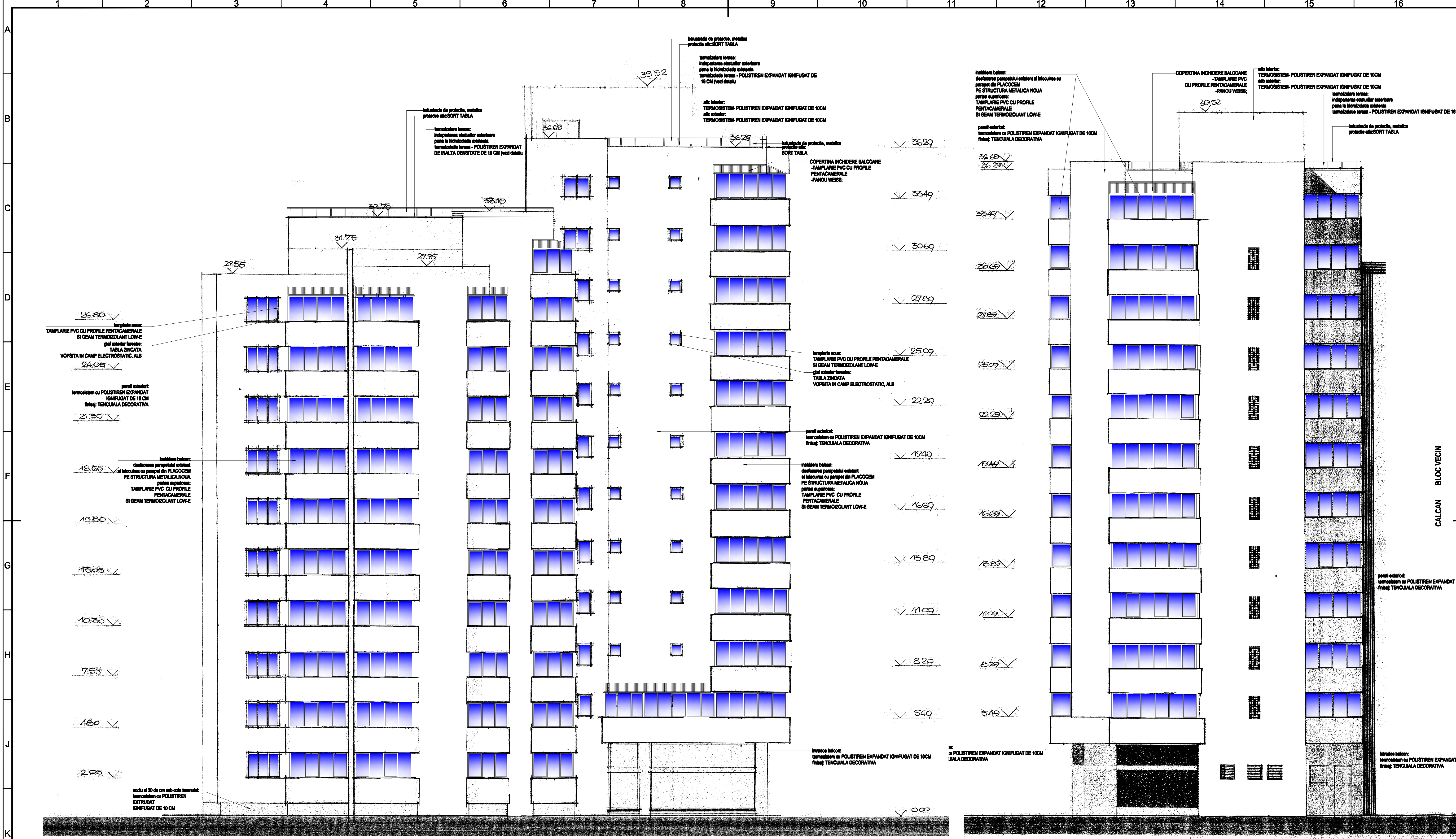
FATADA LATERALA STANGA